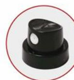
EROGATORE PRODOTTI VERNICIANTI NERO/BIANCO BLACK/WHITE PAINTING PRODUCTS ACTUATOR